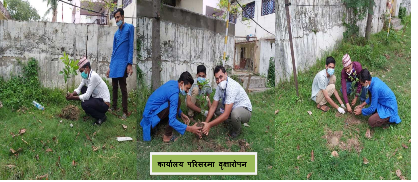
कार्यालय परिसरमा वृक्षारोपन